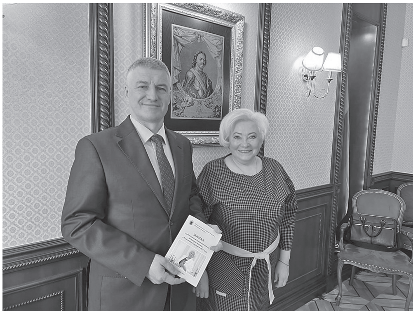
Представление ежегодного Доклада о деятельности Уполномоченного по правам человека в Республике Карелия Главе Республики Карелия Парфенчикову А.О.