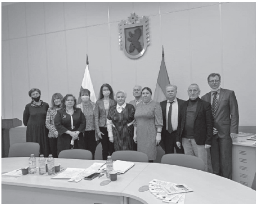
Участники заседания Общественного экспертного совета при УППЧ в РК, по теме «Итоги Единого дня голосования 09-11.09.2022г.» (21.09.2022 г.)